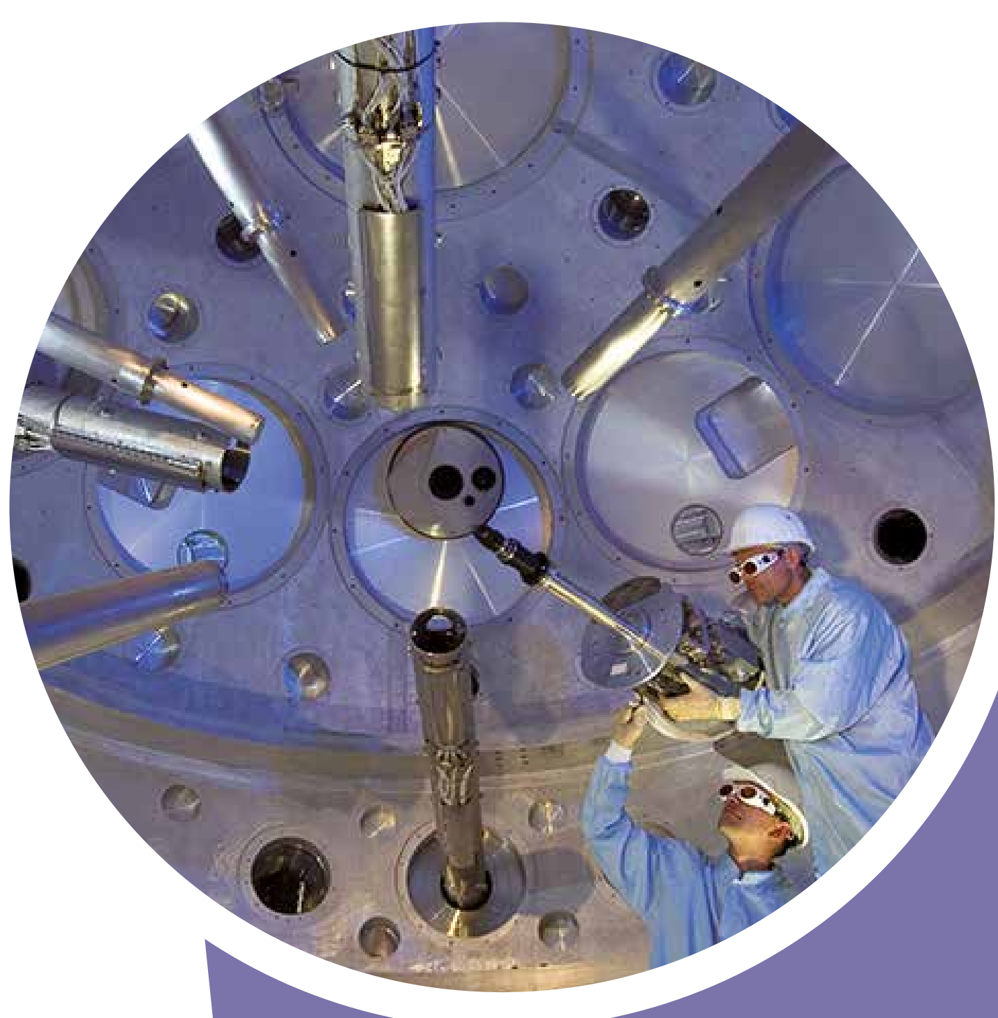
Vue de l'intérieur de la chambre d'expériences sous vide du LIL (Ligne d'intégration laser), mesurant 4,5 mètres de diamètre et pesant 17 tonnes. Dans cette chambre se trouvaient la cible et de nombreux instruments de mesure.

Voilà un être humain à la même échelle, imaginez à quel point ce tokamak est gigantesque !